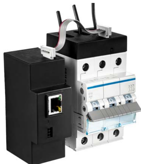
Bild 1 Anwendungsbeispiel: Basismodul, Sensor und 3 einpolige Leitungsschutzschalter

Über ein Konfigurationsprogramm können Sie ENERGYSENS schnell und ohne Programmierkenntnisse in beliebige Systemumgebungen integrieren. Dieses steht auf unserer Homepage zum kostenlosen Download zur Verfügung. Für den Betrieb ist ein Energiedatenmanagement-Programm z. B. SMARTCOLLECT erforderlich. Eine kostenlose Testversion finden Sie ebenfalls auf unserer Homepage.