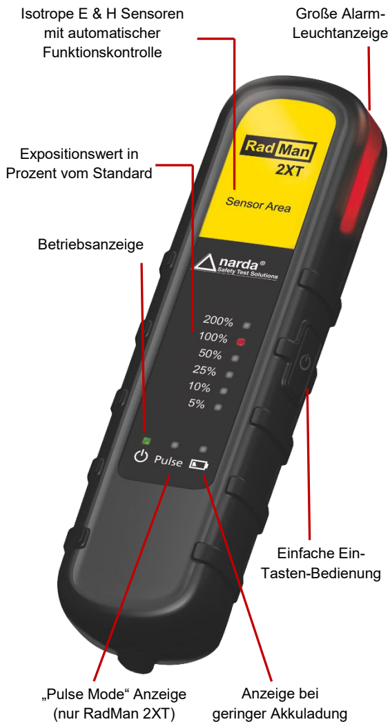
Abb. 1. Vorderansicht mit Bedien- und Anzeigeelementen

Die aktuelle Feldexposition wird über LEDs in sechs Stufen von 5 % bis 200 % angezeigt. Die Prozentangabe entspricht der Grenzwertausschöpfung eines Personenschutzstandards bezogen auf die Leistungsdichte. Wenn die Feldexposition 50 % überschreitet, wird ein lauter Alarmton erzeugt und das Gerät vibriert. Zusätzlich ist im oberen Teil des RadMan 2 eine helle Leuchtanzeige integriert, die aus unterschiedlichen Blickrichtungen gut zu erkennen ist und im Takt des Alarms rot blinkt. Eine zweite Alarmschwelle ab 100 % warnt noch eindringlicher und man sollte den Gefahrenbereich verlassen. Geräteversionen mit über PC-Software einstellbaren Alarmschwellen sind ebenfalls erhältlich.