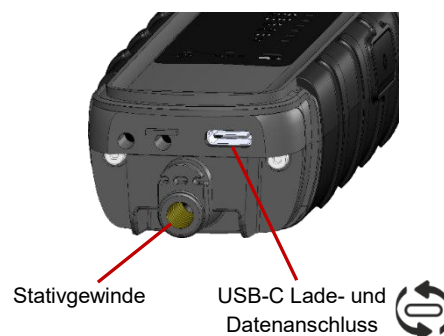
Abb. 2. Ansicht bei geöffneter Abdeckung

Für ein weiteres Plus an Sicherheit sorgt der neuentwickelte Sensortest, der nach jedem Einschalten des RadMan 2 die ordnungsgemäße Funktion der einzelnen Sensoren überprüft. Das Gerät muss vor Arbeitsbeginn nicht mehr mit einem Testgenerator geprüft werden.