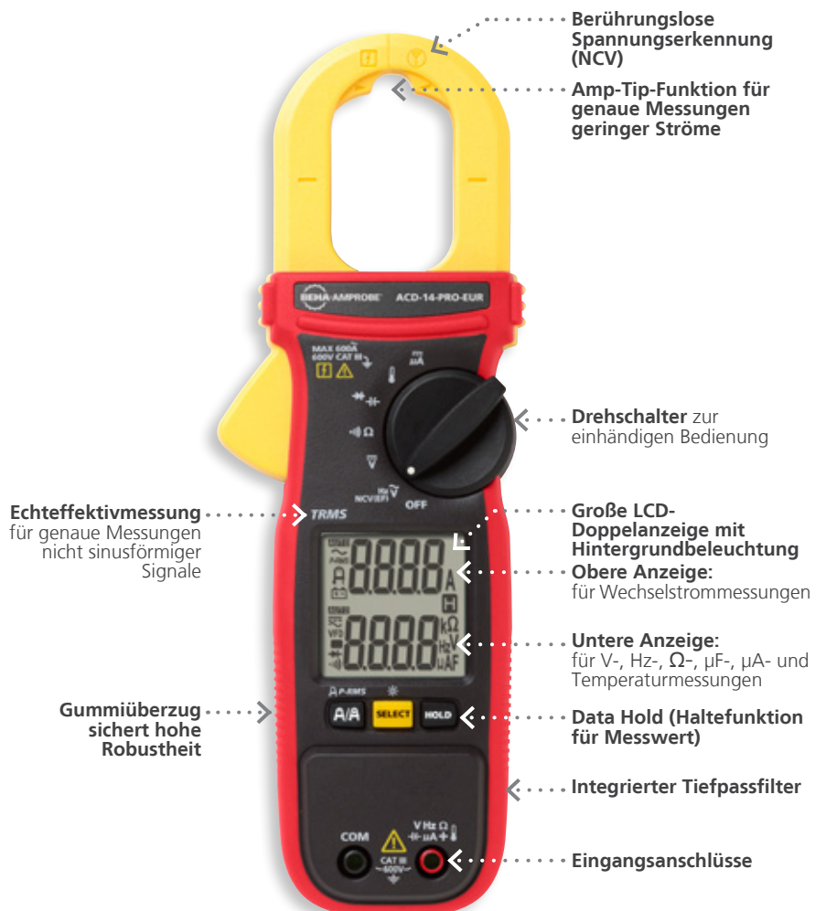
ACD-14-PRO-EUR Echtheffektiv-Strommesszange bis 600 A mit Doppelanzeige