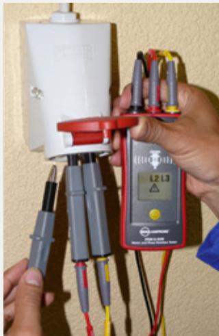
Überprüfung einer CEE-Drehstromsteckdose