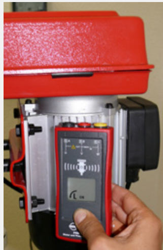
Berührungslose Motordrehrichtungsanzeige bei laufendem Motor