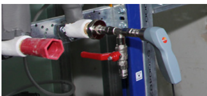
Belastungsprüfung mit Wasser oder Druck > 1 bar mit Hochdrucksonde und -anschluss