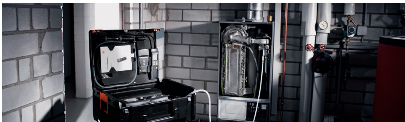
Automatische Gebrauchsfähigkeitsprüfung mit Einspeisevorrichtung mit Anschluss an die Gastherme