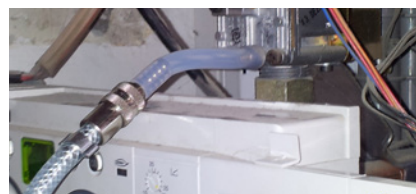
Gebrauchsfähigkeitsprüfung mit dem Adapter über die Gastherme