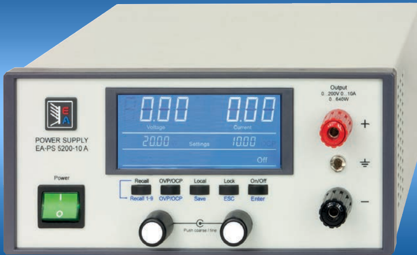
EA-PS 5200-10 A