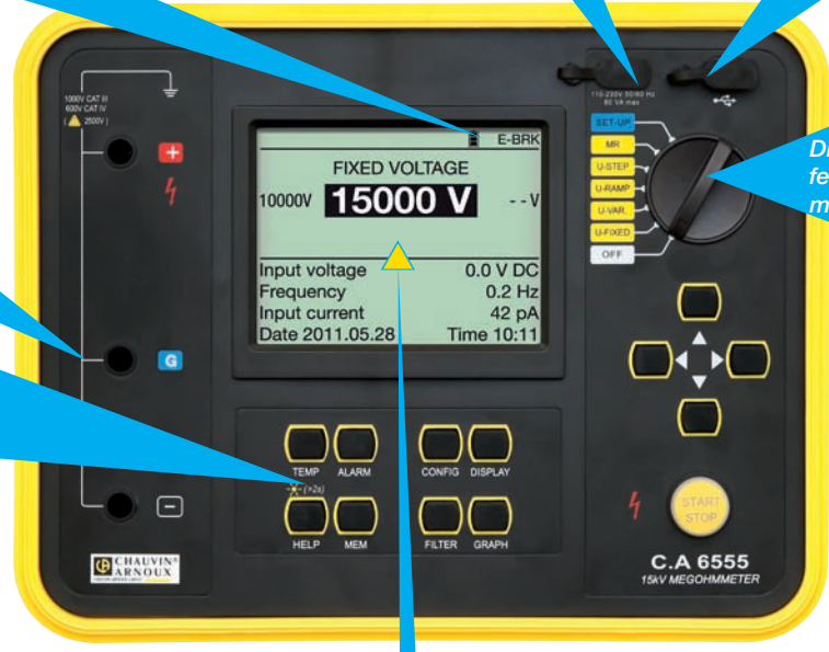
Großes grafisches LC-Display mit Hintergrundbeleuchtung

Arbeiten Sie in voller Sicherheit mit Messzubehör 1000 V CAT IV