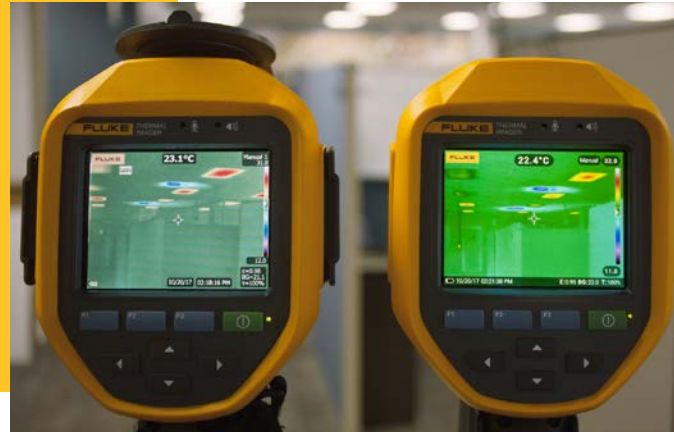
Abbildung 1. Vergleich der Bildschirmanzeige zwischen Ti450 und Ti450 PRO

Die Wärmebildkameras Fluke Ti480 PRO, Ti450 PRO, Ti400 PRO und Ti300 PRO können jetzt in Verbindung mit mehr Infrarot-Wechselobjektiven eingesetzt werden. Zur besseren Darstellung von Zielobjekten können jetzt Makro-, Tele- oder Weitwinkelobjektive an der Kamera montiert werden. Fluke Wechselobjektive sind zwischen kompatiblen Kameras ohne Kalibrierung austauschbar.