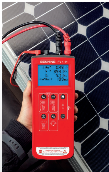
Automessung am PV-Strang (Uoc, Isc, Riso)