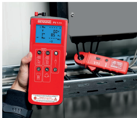
DC-Betriebsstrommessung mit BENNING CC 3