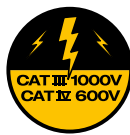
An allen Eingängen