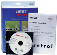
0701/0702/0113 Software es control professional