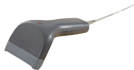
BC-1250G, schwarz Barcode-Scanner inkl. USB-Kabel