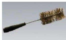
PAT-BRUSH Bürstensonde 4 mm Stecktechnik