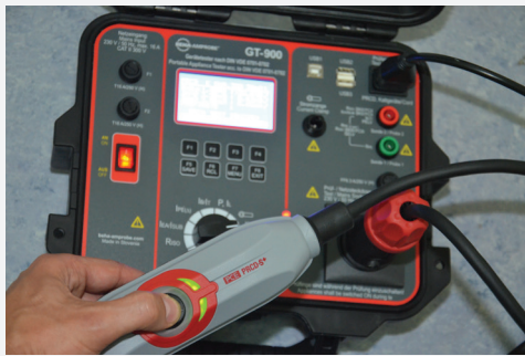
Prüfung von ortsveränderlichen Fehlerstrom-Schutzschaltern (PRCD, PRCD-S, PRCD-S+, PRCD-K)