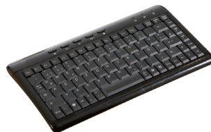
KBGE-MT204S USB Tastatur