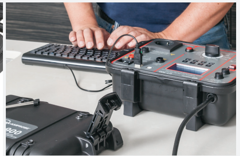
Drei separate USB-Schnittstellen zum gleichzeitigen Anschluss an PC und Eingabegeräten wie USB-Tastatur, USB-BarcodeScanner, USB-Speicher oder Bluetooth Geräte mit USB-Dongle (optional)