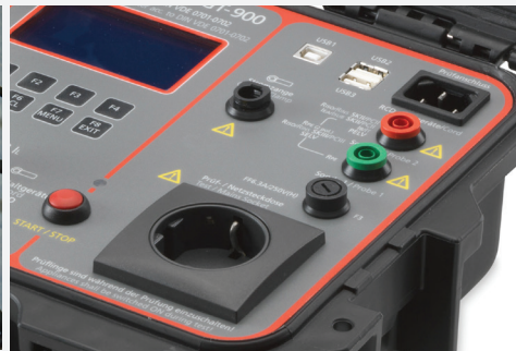
Anschluss für externen Stromzangenadapter (optional Beha-Amprobe CHB 1) zur Messung von Schutzleiterströmen auch an 3-phasigen Prüflingen