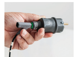
Adapter-PE für Schutzleiter