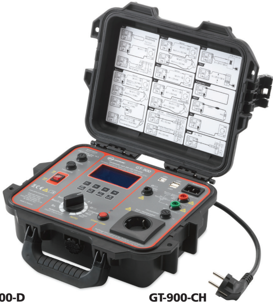
GT-900-D Gerätetester für Prüfungen nach DIN VDE 0701-0702 und DGUV Vorschrift 3 (BGV A3) mit Schuko Netzkabel und Schuko Prüf-/Netzsteckdose.